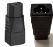
PA-1 Adapter Kaltgeräte auf Klebblatt (IEC C6-C13)