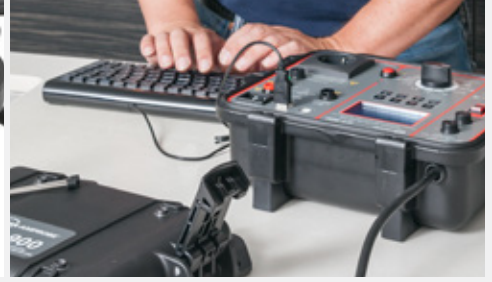
Drei separate USB-Schnittstellen zum gleichzeitigen Anschluss an PC und Eingabegeräten wie USB-Tastatur, USB-Barcodescanner, USB-Speicher oder Bluetooth Geräte mit USB-Dongle (optional)