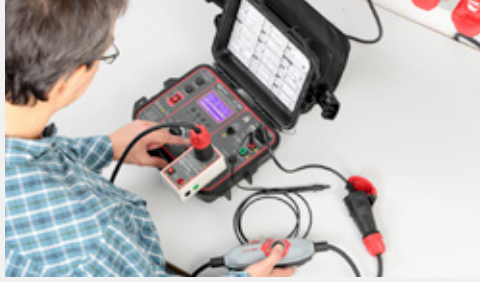
Prüfung von ortsveränderlichen Fehlerstrom-Schutzschaltern (PRCD, PRCD-S, PRCD-S+, PRCD-K) (nur GT-900).