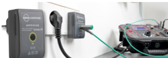
ADPTR-PE-EUR Socket Check Adapter Schuko PE