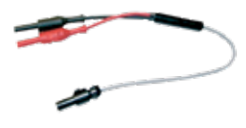
ACF-6A Adapterkabel für Stromzange