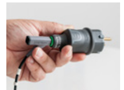
Adapter-PE für Schutzleiter