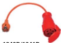
1240D/1241D Drehstromadapter 16 A CEE 5-polig 1240D 32 A CEE 5-polig 1241D