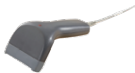
BC-1250G, schwarz Barcode-Scanner inkl. USB-Kabel