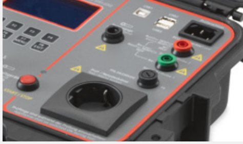
Anschluss für externen Stromzangenadapter (optional Beha-Amprobe CHB 1) zur Messung von Schutzleiterströmen auch an 3-phasigen Prüflingen (nur GT-900).