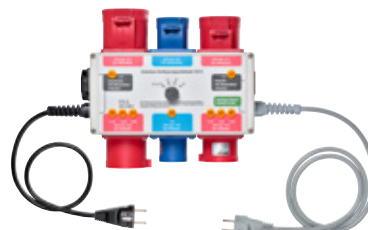
VLP-5 Drehstrom- Verlängerungsprüfadapter