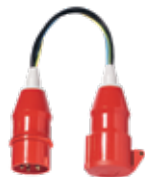
1235D/1236D Messadapter CEE 5-polig 16 A 1235D CEE 5-polig 32 A 1236D