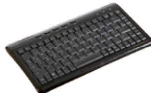
KBGE-MT2045 USB Tastatur