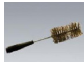
PAT-BRUSH Bürstensonde 4 mm Stecktechnik