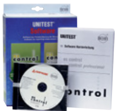
0701/0702/0113 Software es control professional

Gerätetester für Prüfungen nach SNR 462638 und electrosuisse info 3024 d mit schweizer Netzkabel (Typ 12) und Prüf-/Netzsteckdose (Typ 23).