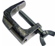
Kl. Schraubstock (Bananenstecker) WAZACIMA1