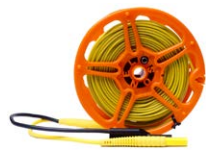
Prüfleitung 50 m auf Spule (Bananenstecker, abgeschirmt) gelb WAPRZ050YEBBSZE