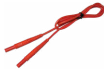
Prüfleitung 1,2 m (Bananenstecker) rot WAPRZ1X2REBB