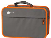
Etui L-2 WAFUTL2