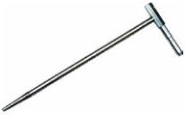
4x Sonde 30 cm WASONG30