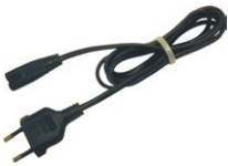
Stromversorgungskabel 230 V (IEC C7) WAPRZLAD230