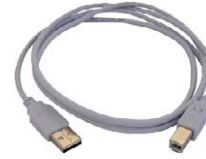
USB Kabel WAPRZUSB