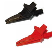
Krokodilklemme 1 kV 20 A schwarz / rot WAKROBL20K01 WAKRORE20K02