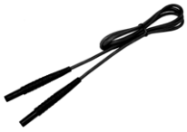
Prüfleitung 2,2 m (Bananenstecker) schwarz WAPRZ2X2BLBB