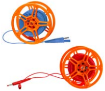
Prüfleitung 25 m auf Spule (Bananenstecker) blau / rot WAPRZ025BUBBSZ WAPRZ025REBBSZ